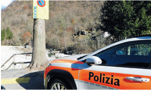
La vittima è deceduta sul posto

Infortunio letale per un 50enne domiciliato nella regione